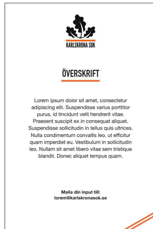
Exempel på poster/flyer