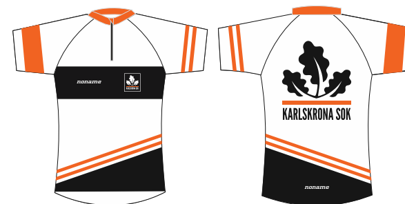
Karlskrona SOK:s första orienteringströja

I Karlskrona SOK:s första uppsättning av tävlingskläder är den orangea linjen ett viktigt element. Där i form av två parallella diagonala linjer. Detta kan med fördel också användas för att fylla ut tomrum och ge liv åt exempelvis flyers och affischer. Lutningen bör då vara 20-30 grader mot horisontalplanet (se exempel till höger).