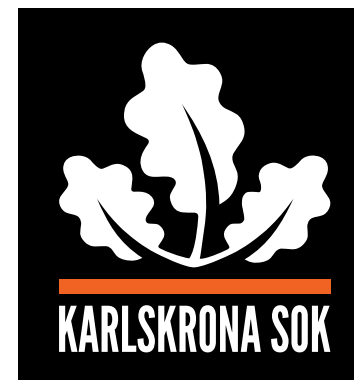
Logotyp i färg - svart bakgrund