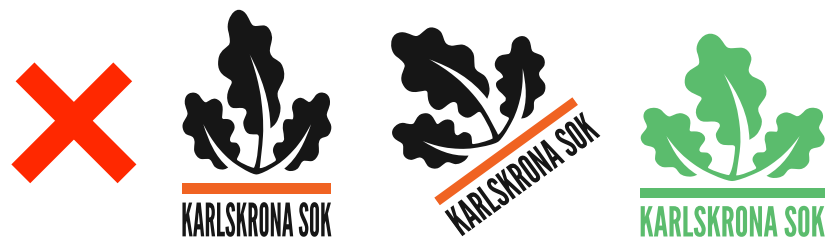
Exempel på felaktig användning av logotyp