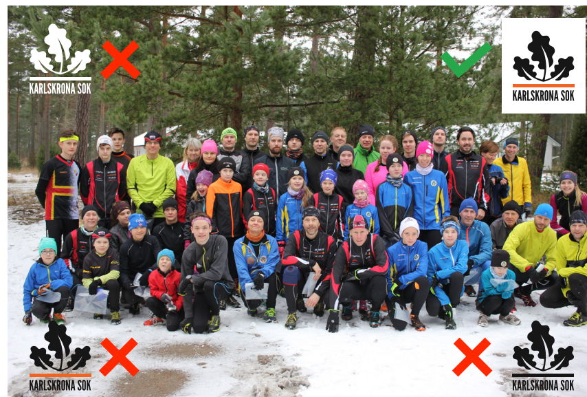
Exempel på användning av logotyp på flerfärgad bakgrund

Logotypen ska ej deformeras, vridas, eller presenteras i annan färg.