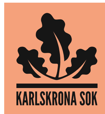
Logotyp svart - ljus bakgrund