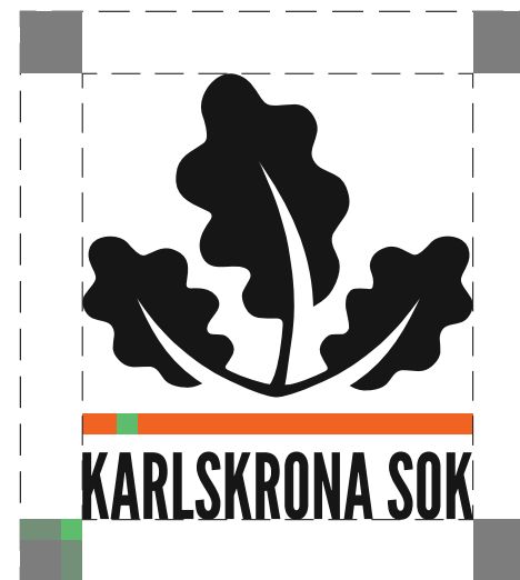
Skyddszon - 3 x höjden på linjen

Logotypens höjd bör ej vara mindre än 30 mm.