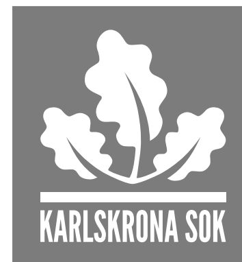
Logotyp vit - mörk bakgrund